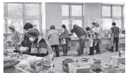
福祉バザーの様子