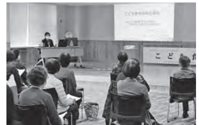
ボランティア養成講座

ボランティア養成講座や交流会を開催し、福祉活動の担い手の確保、ボランティアの育成に取り組みます。