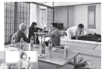
介護者 リフレッシュ事業

・チャイルドシートの無料貸出(クリーニング代として1,650円負担いただきます。)