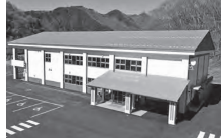
高齢者福祉センター

福祉団体に対して活動資金助成をし、団体の活動を支援します。また、高齢者が地域で安心して生活できるよう、日頃からの見守り活動を推進します。