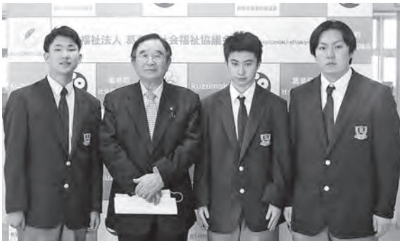
2年Aコースの代表3人と辰柳会長

販売実習を体験した3人は、高校生のうちに貴重な経験をすることができ、お金の動きも勉強することができた。また、実際の企業とのやり取りで商談を断られたり実習ならではの体験は、すごく有意義だったと振り返っていました。