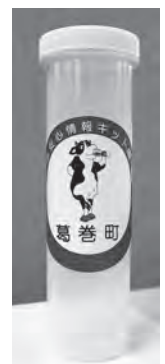
「緊急時連絡カード（見本）」と「ケース」