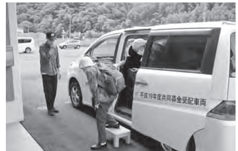
高齢者福祉センター浴室営業日の送迎