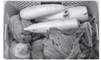
実際に提供いただいた野菜