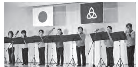
福祉チャリティーショー