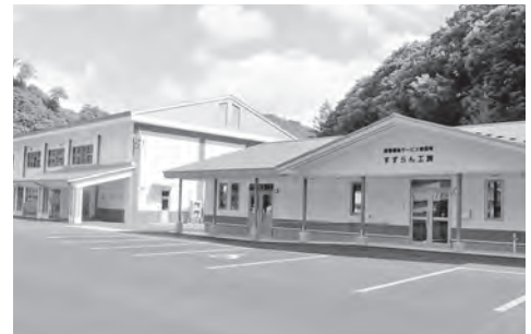
「すずらん工房」新施設