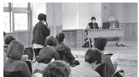
ボランティア養成講座