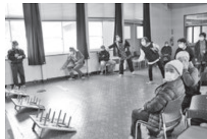
ふれあいサロン「やすみっこ」