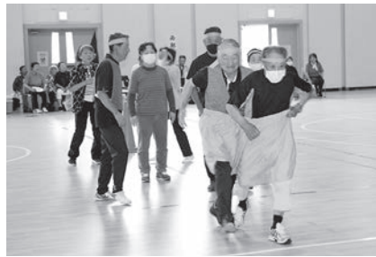
⑤ デカパンリレー【新種目】