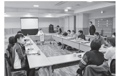
介護者リフレッシュ事業