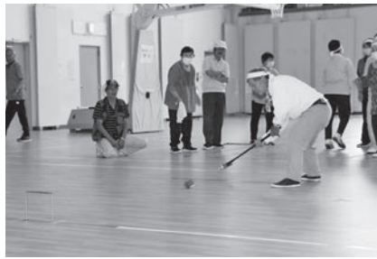
② ゲートボールリレー