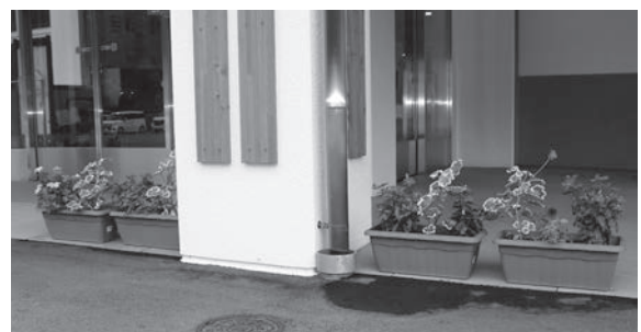
仲町生花店 寄贈「花の寄せ植えプランター」

◆ 電話番号が記載されている記事については、そちらにお問い合わせください。 それ以外については、【葛巻町社会福祉協議会 電話：0195-68-7161】へお願いします。