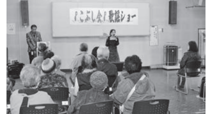
やすみっこ(冬部自治会)