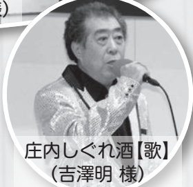
庄内しぐれ酒【歌】 (吉澤明 様)