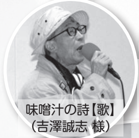
味噌汁の詩【歌】 (吉澤誠志 様)