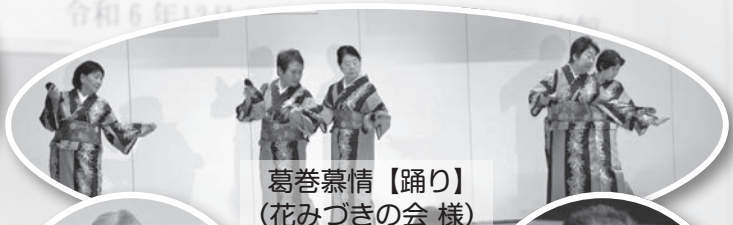
葛巻慕情【踊り】 (花みづきの会 様)