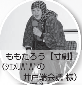
ももたろう【寸劇】 (江刈ハバの 井戸端会議 様)