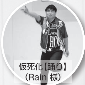
仮死化【踊り】 (Rain 様)