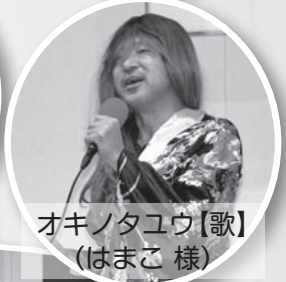
オキノタユウ【歌】 (はまこ 様)