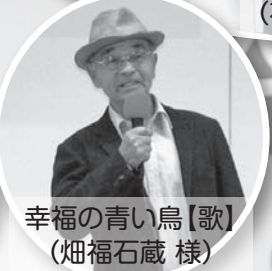
幸福の青い鳥【歌】 (畑福石蔵 様)