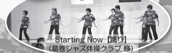
Starting Now【踊り】 (葛巻ジャズ体操クラブ 様)