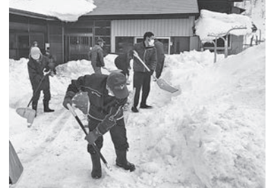
福祉事業(専門自治会)