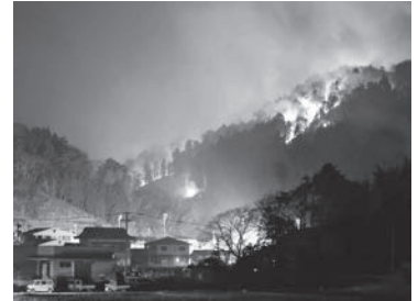
大船渡市赤崎町の様子