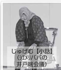
じゅげむ【小話】 (シメリババの 井戸端会議)