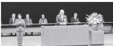
挨拶する県社協 千葉会長

第78回岩手県社会福祉大会が11月14日(金)、トーサイクラシックホール岩手で開催され、長年にわたり県内の社会福祉分野で活躍された方々の表彰が行われ、当町からは、次の6名が受賞されました。おめでとうございます。