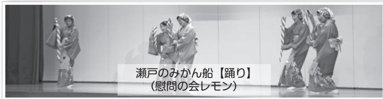
瀬戸のみかん船【踊り】 (慰問の会レモン)