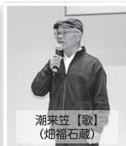
潮来笠【歌】 (畑福石蔵)