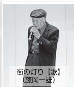
街の灯り【歌】 (藤岡一雄)