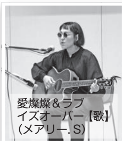
愛燦燦&ラブ イズオーバー【歌】 (メアリー・S)